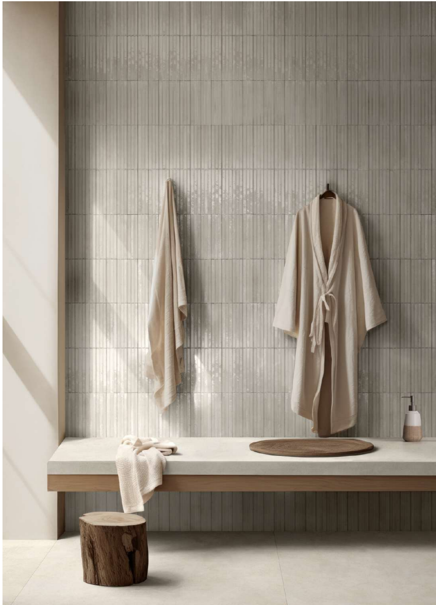
R8XA Stratford White Rt 120x120cm - RCFP Stratford White Natural Rt 120x278cm - RCU2 Look Bianco Struttura 3D Yubi Glossy 6x24cm