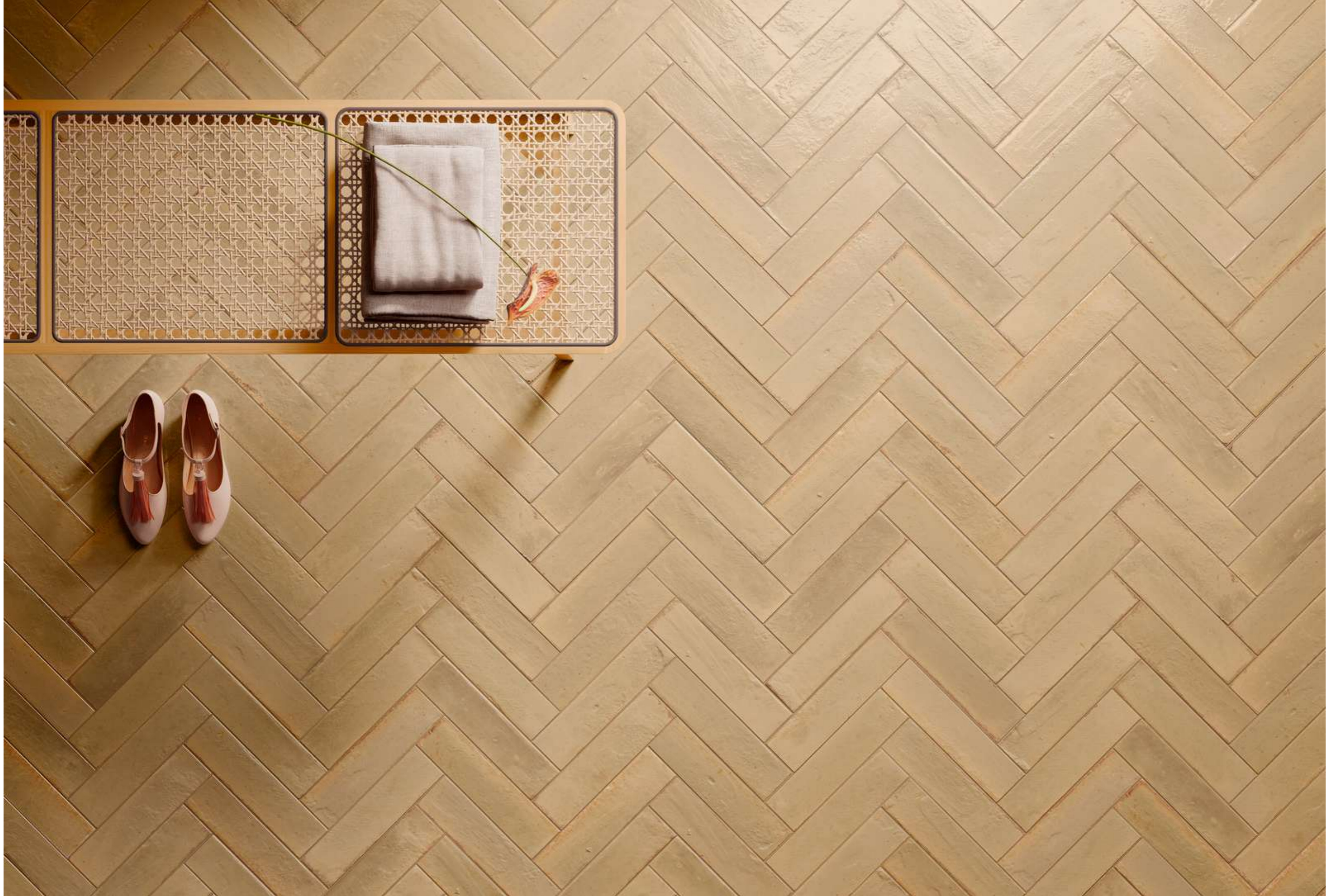
R8FP Look Beige Glossy 6x24cm