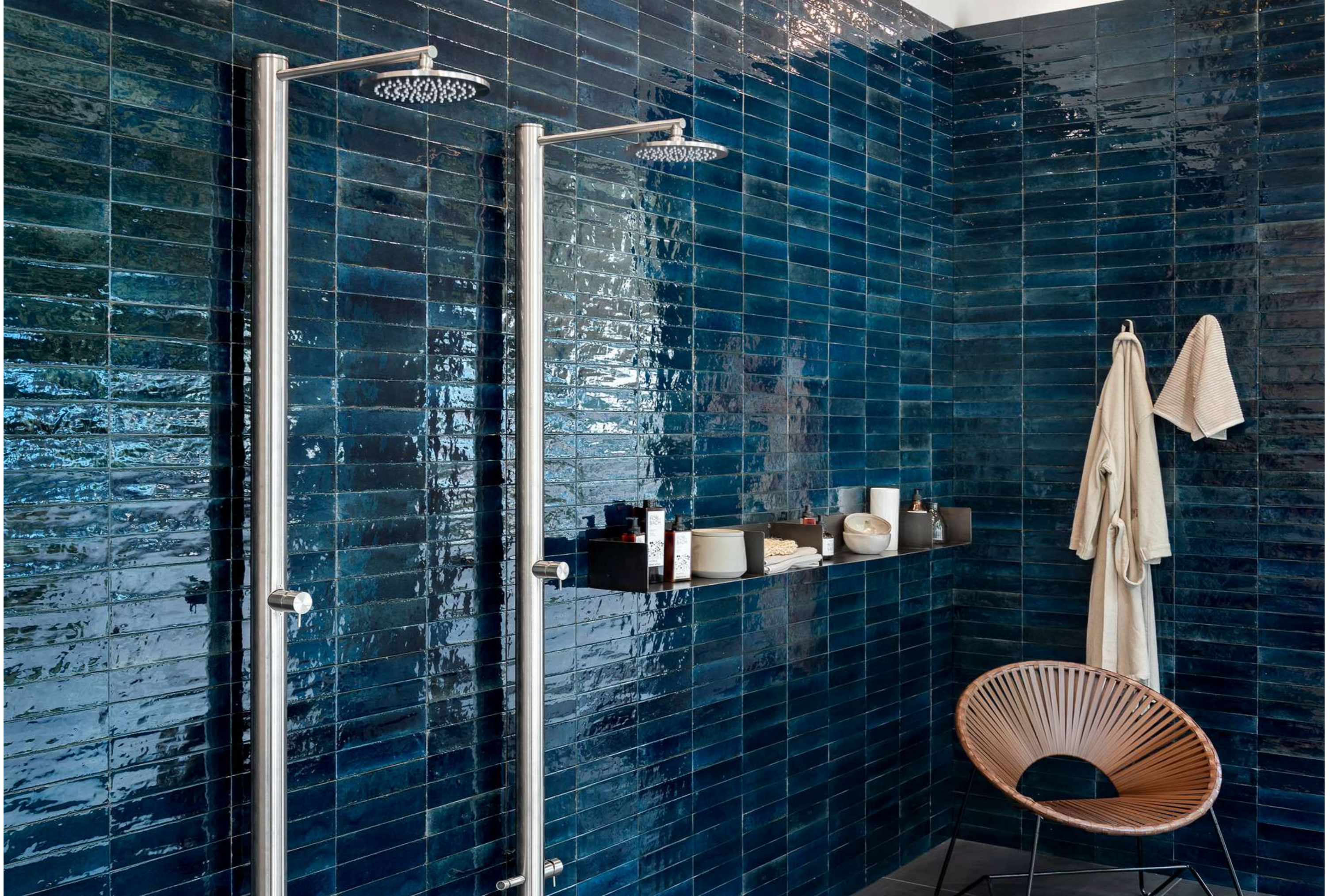
R8FR Look Blu Glossy 6x24cm