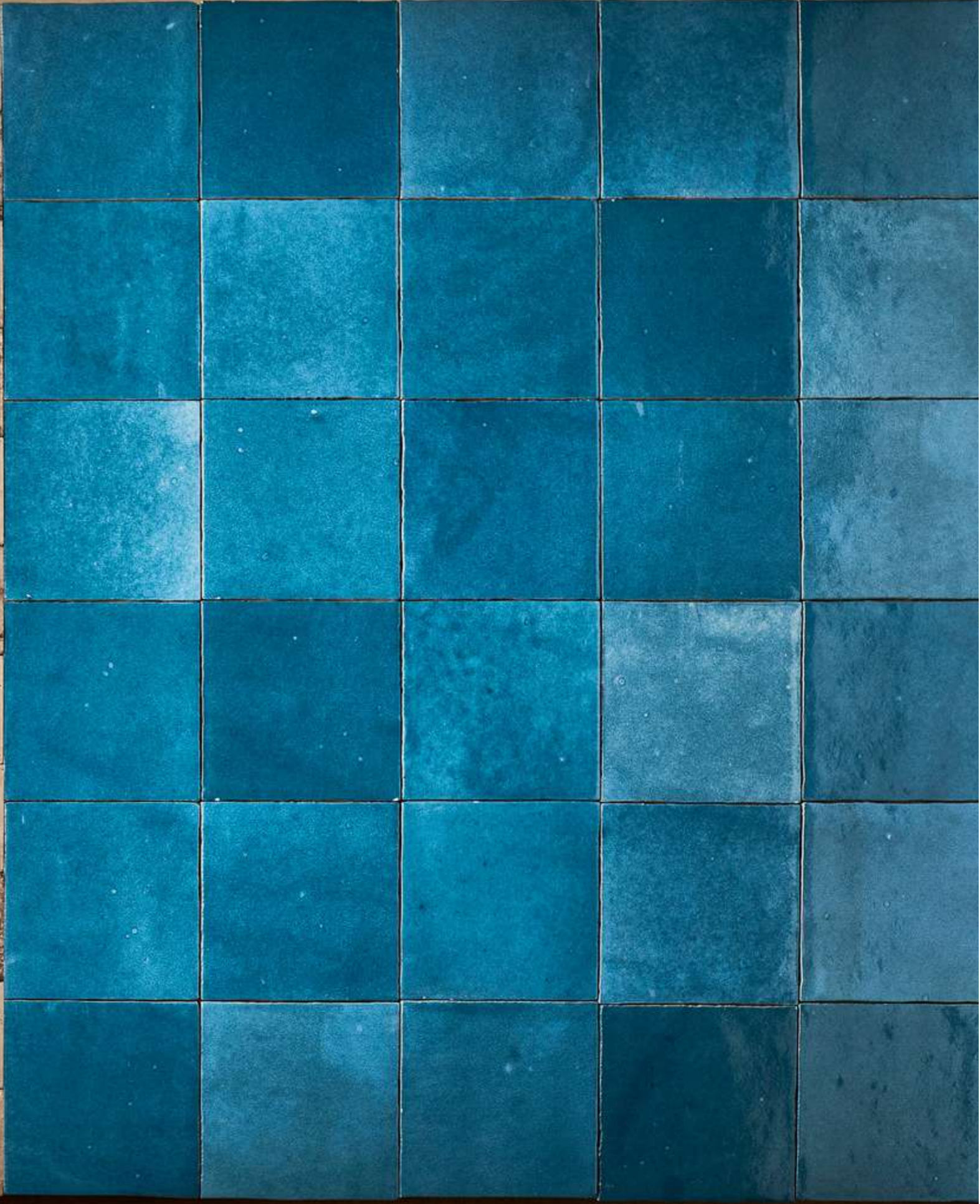
R8FP Look Beige Glossy 6x24cm - R8GD Mélange Acquamarina Glossy 10x10cm