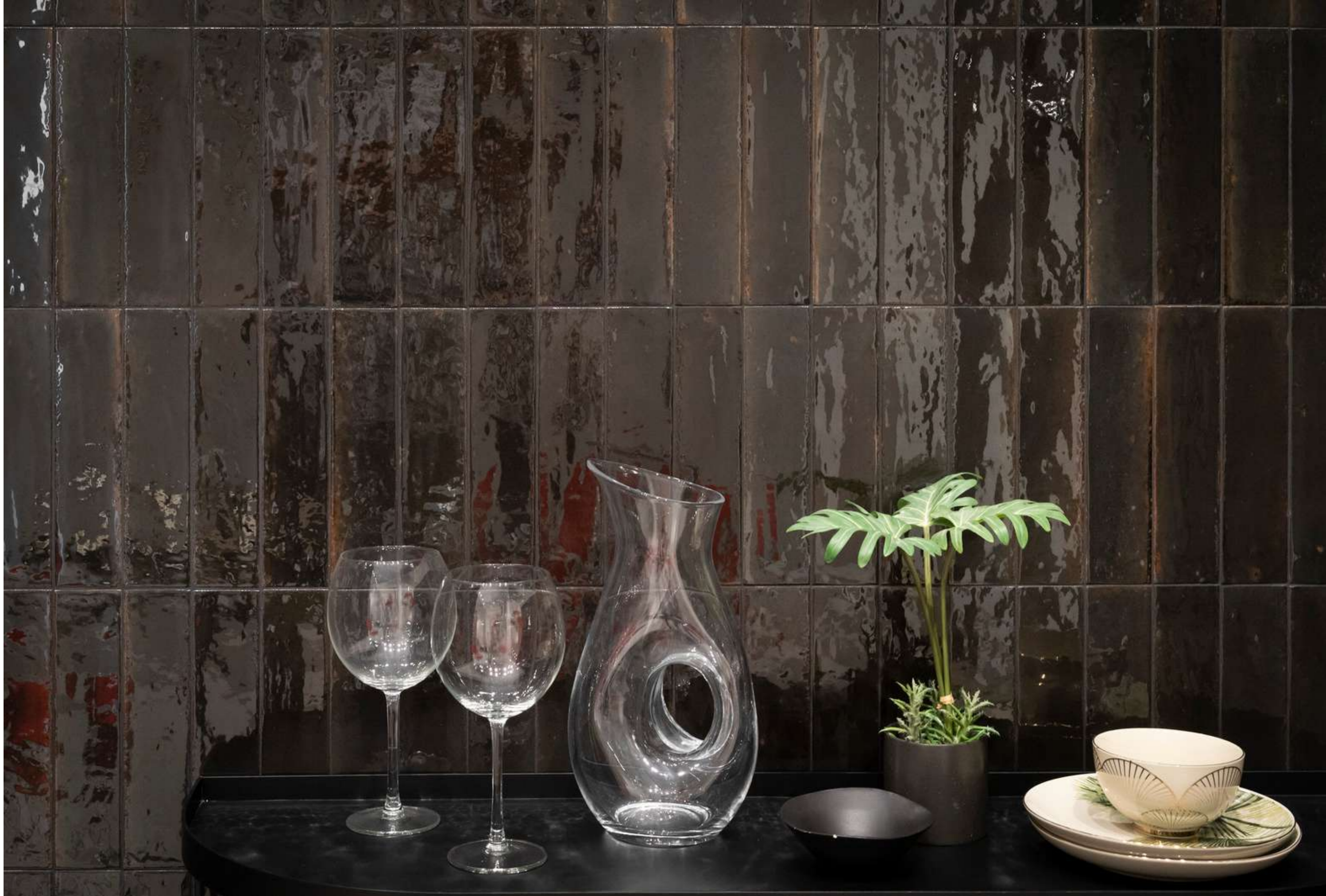
R8FN Look Nero Glossy 6x24cm