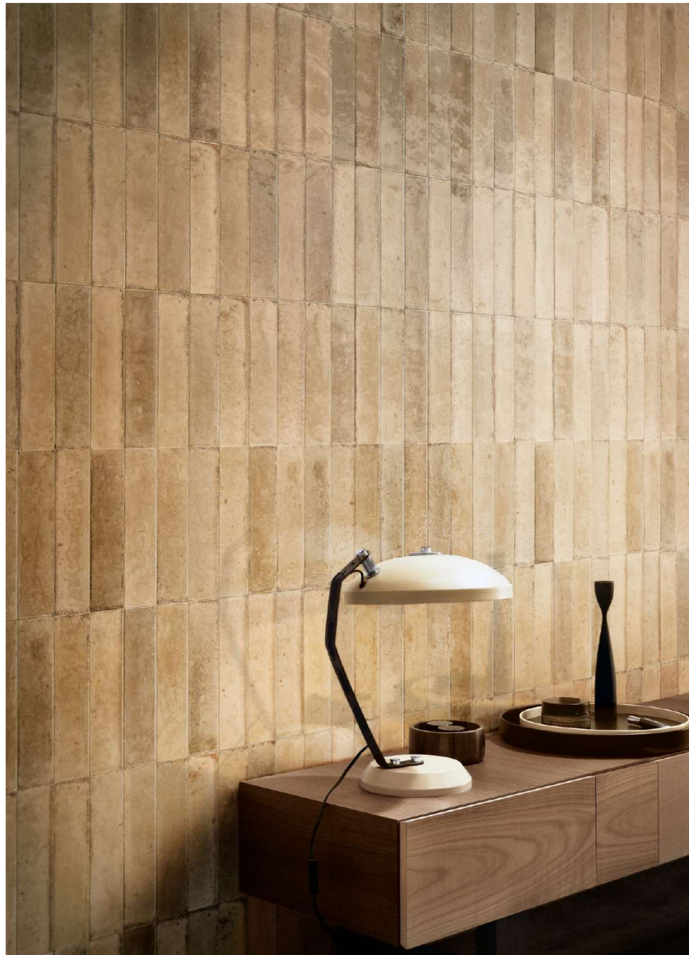
R8FP Look Beige Glossy 6x24cm