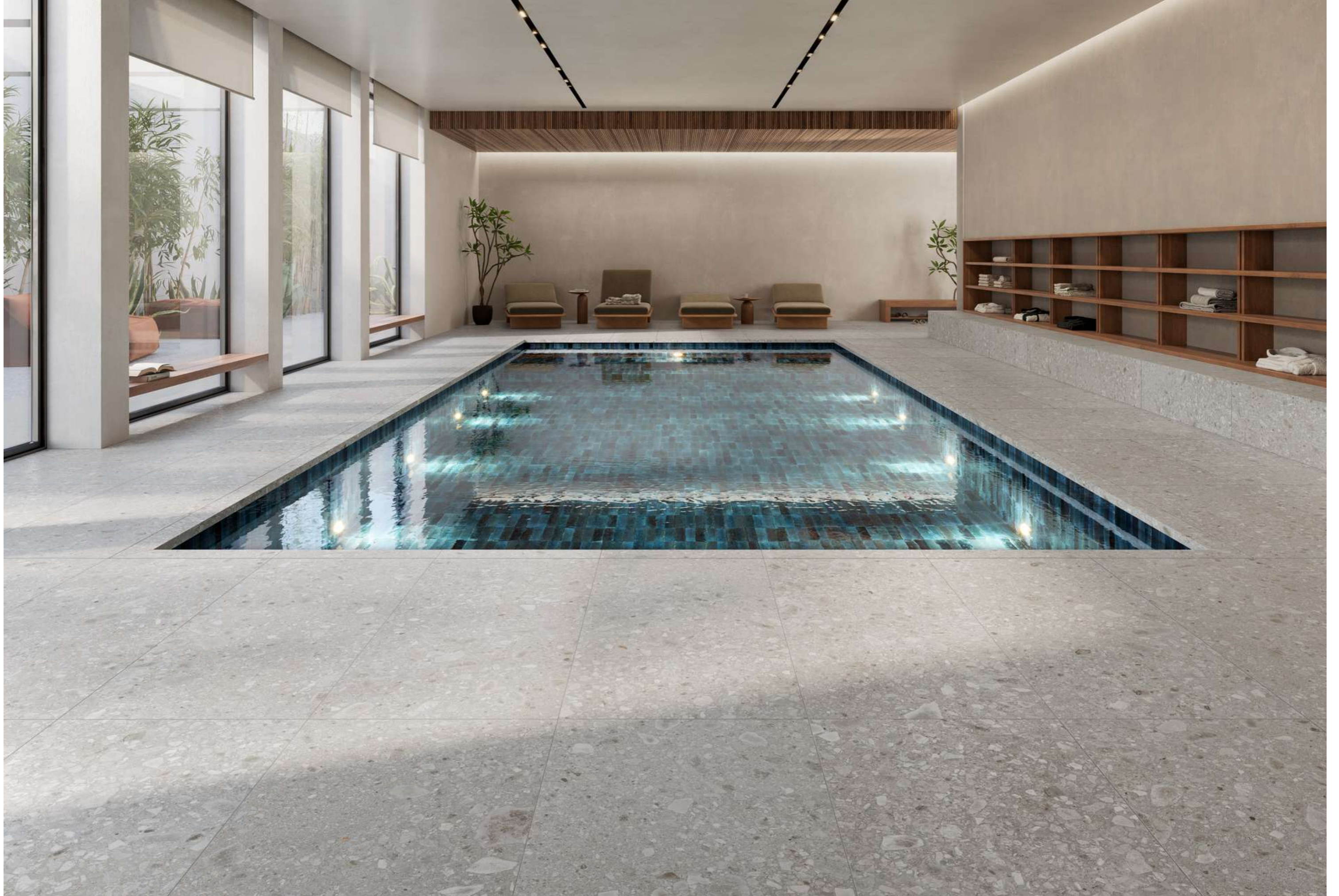
R8FR Look Blu Glossy 6x24cm - RCYQ Ceppo Xt20 Bianco Rt 60x120cm - RD1N Ceppo Xt20 Bianco Elemento L Rt 15x120cm