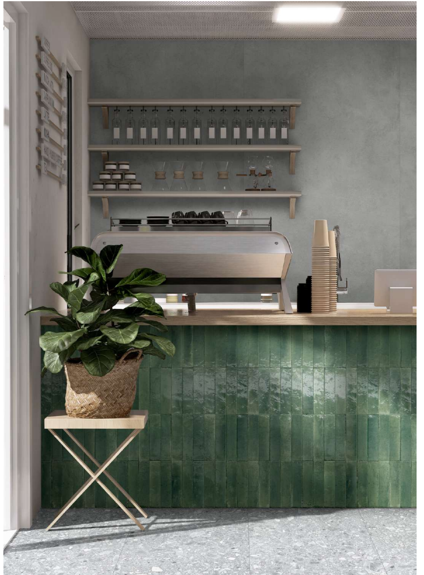
RCFK Stratford Dark Grey Natural Rt 120x278cm - RCTZ Look Verde Glossy 6x24cm - RCWX Ceppo Grigio Rt 60x120cm - RCX3 Ceppo Grigio Strutturato Rt 60x120cm