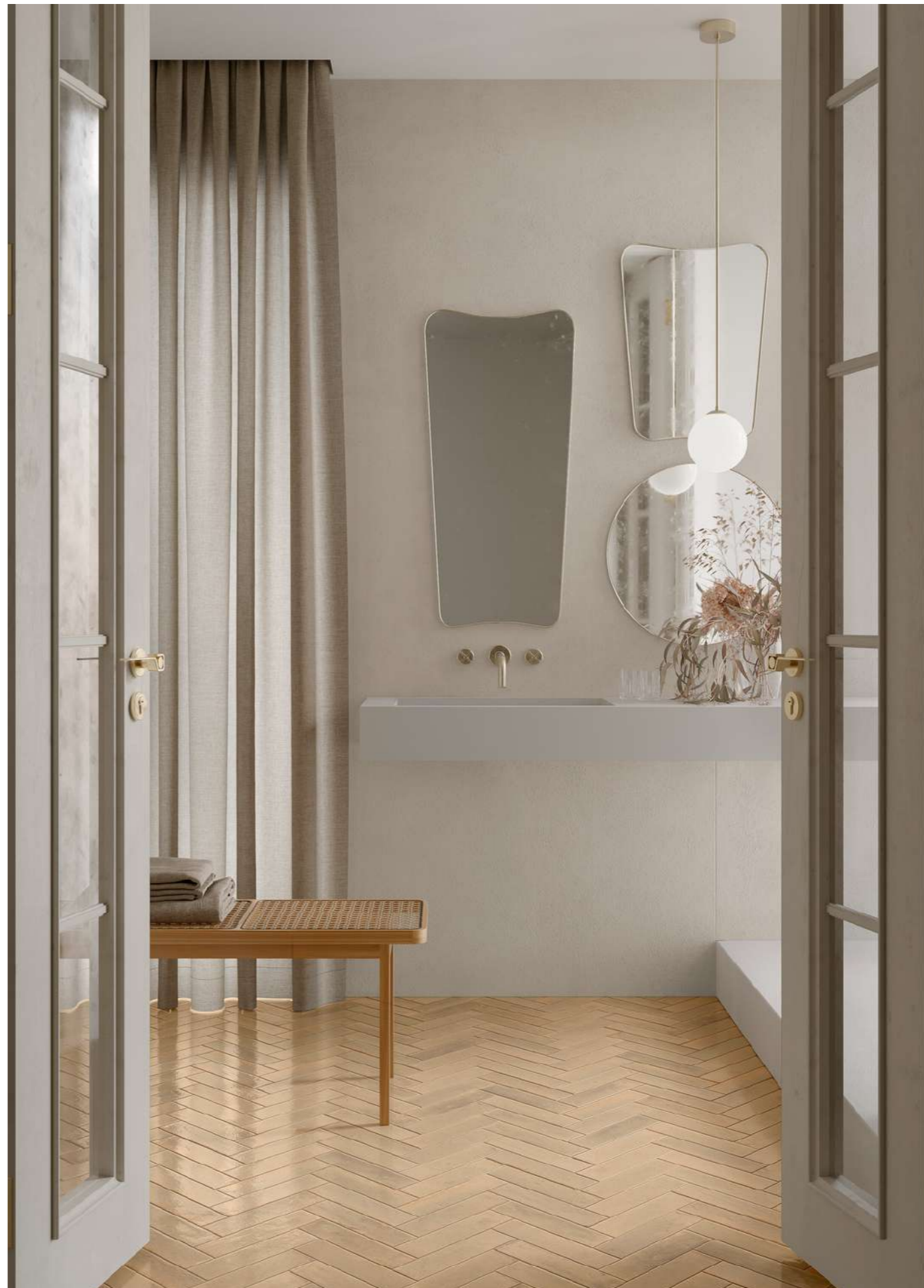
R7GL Maiora_Concrete Effect Bianco Natural Rettificato 120x278cm - R8FP Look Beige Glossy 6x24cm