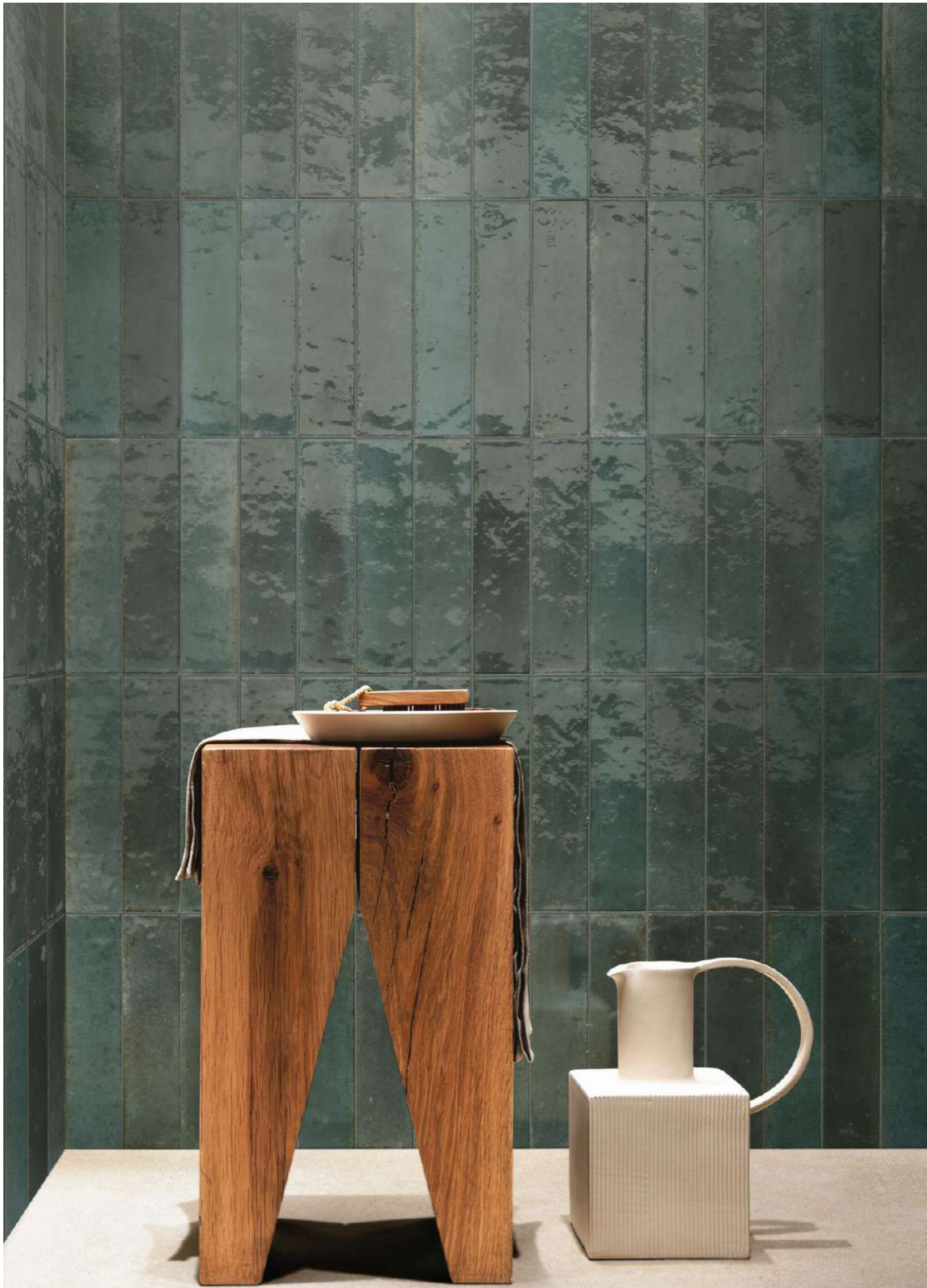
R53H Boom Luce Rt 75x75cm - R8FQ Look Avio Glossy 6x24cm