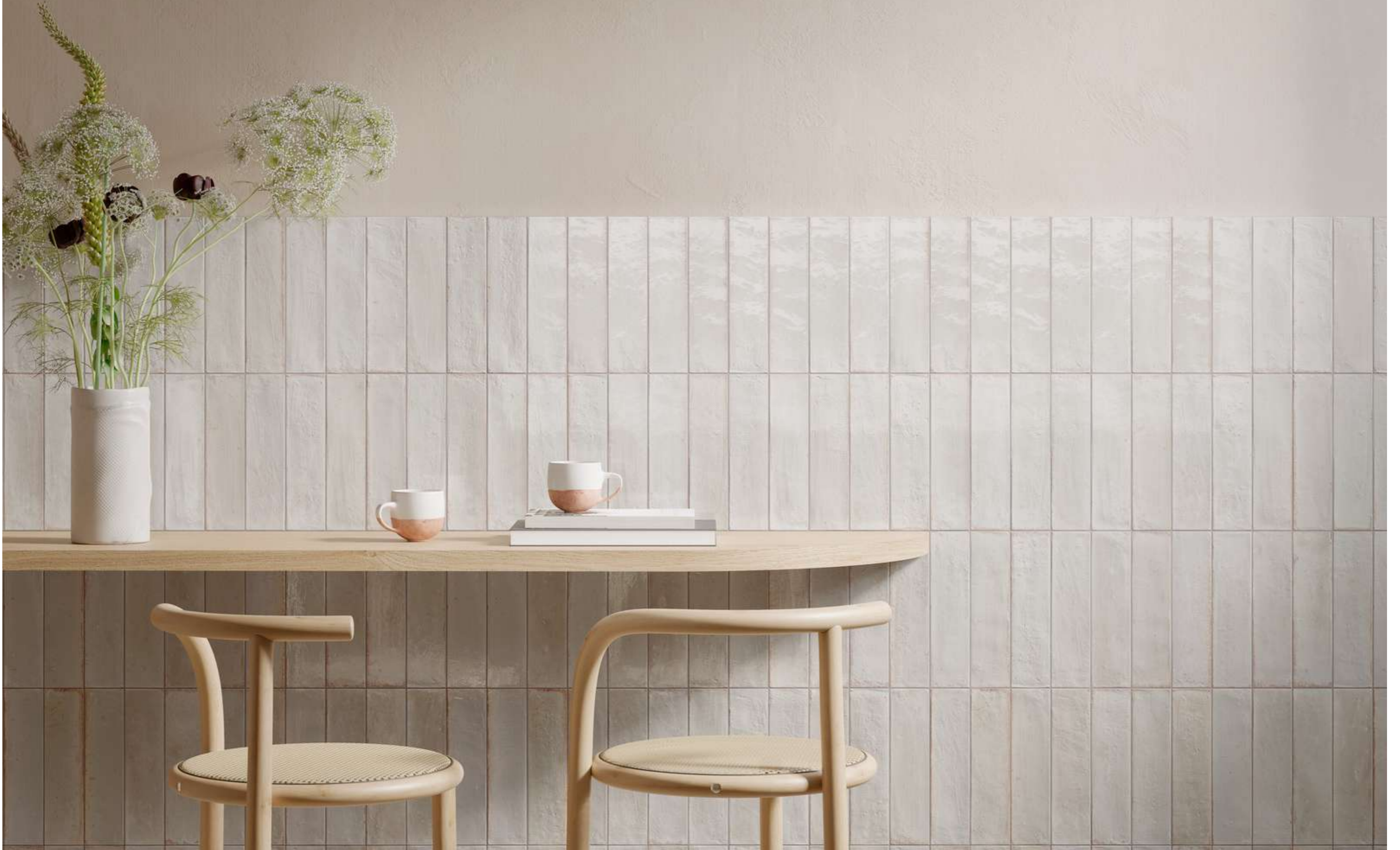
R8FM Look Bianco Glossy 6x24cm