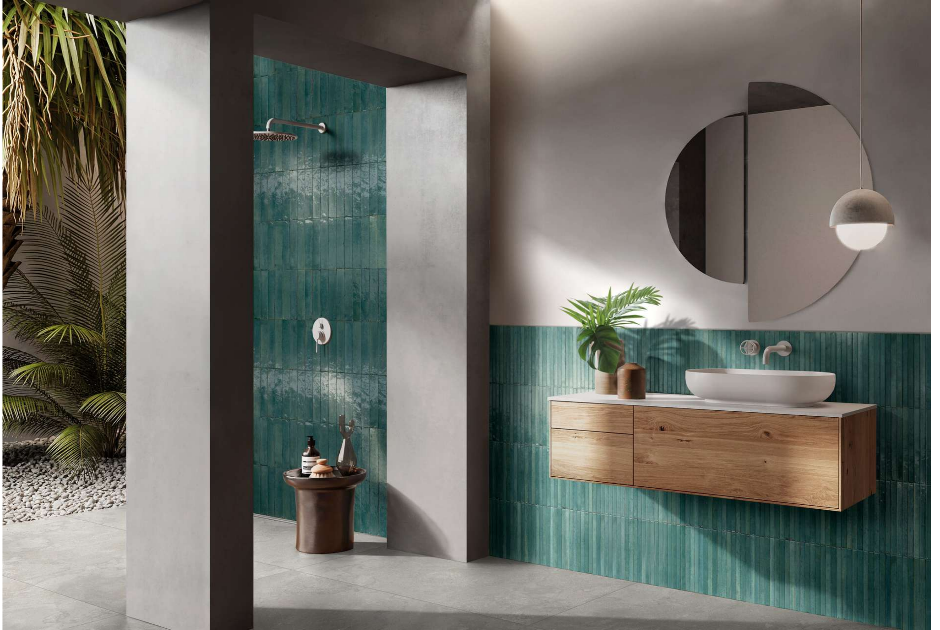
RCU0 Look Turchese Glossy 6x24cm - RCU3 Look Turchese Struttura 3D Yubi Glossy 6x24cm - RCVP Stoneplay Cliff Grey Rt 60x120cm - RCWV Stoneplay Cliff Grey Strutturato Rt 60x120cm