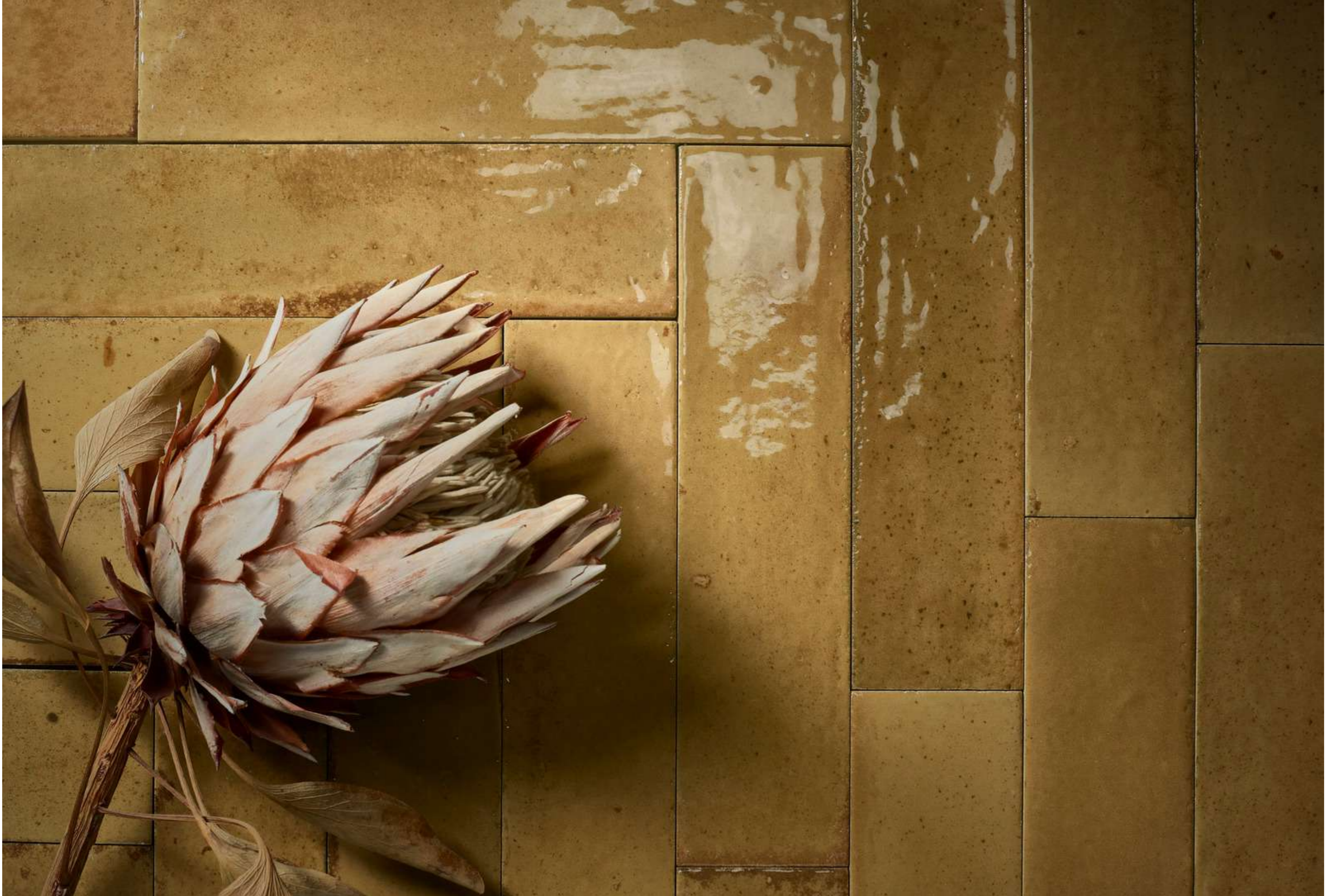
R8FT Look Ocra Glossy 6x24cm