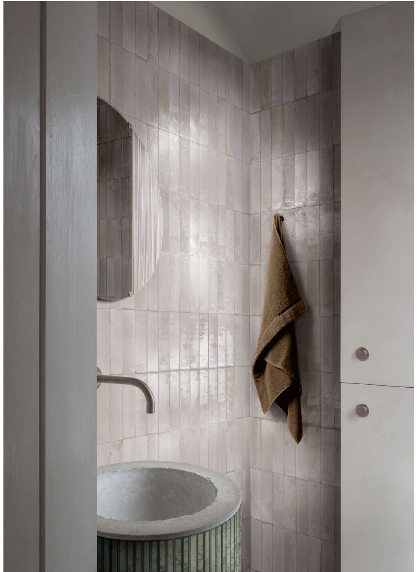
R8FM Look Bianco Glossy 6x24cm - RCU5 Look Oliva Struttura 3D Yubi Glossy 6x24cm