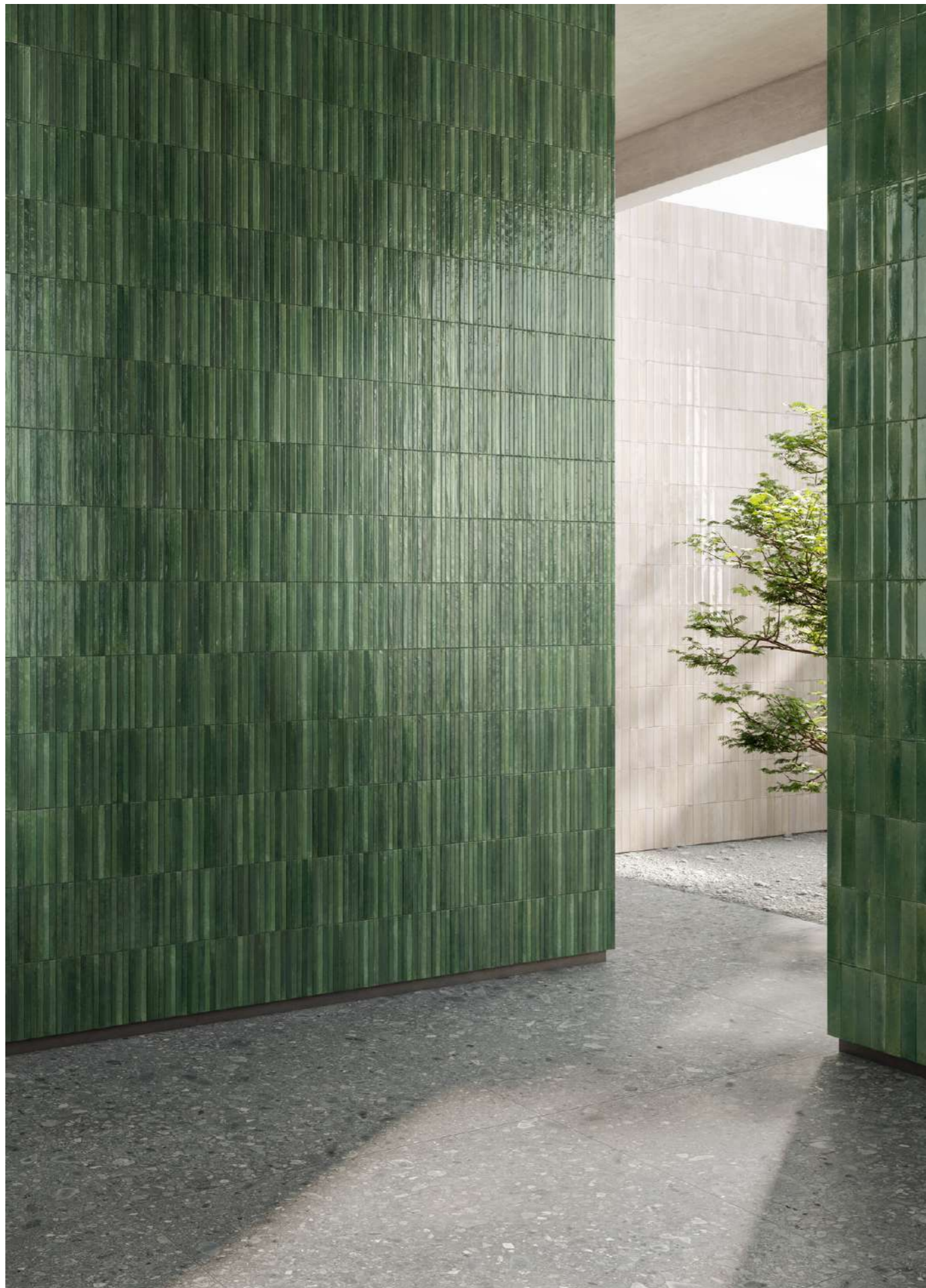
R8FM Look Bianco Glossy 6x24cm - RCTZ Look Verde Glossy 6x24cm - RCU8 Look Verde Struttura 3D Yubi Glossy 6x24cm - RCWS Ceppo Grigio Strutturato Rt 120x120cm