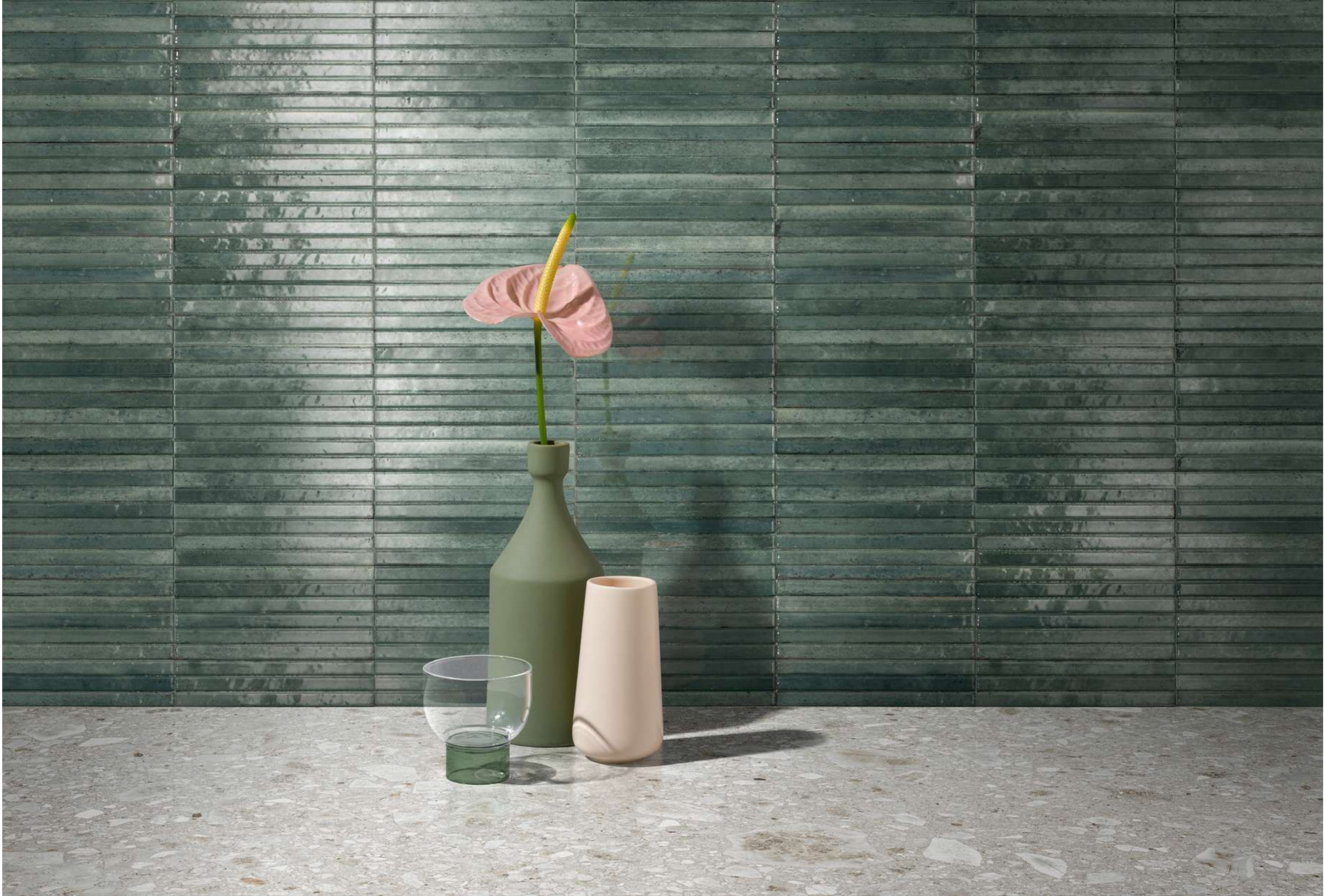
RCU9 Look Avio Struttura 3D Yubi Glossy 6x24cm - RCXN Ceppo Bianco Rt 90x180cm