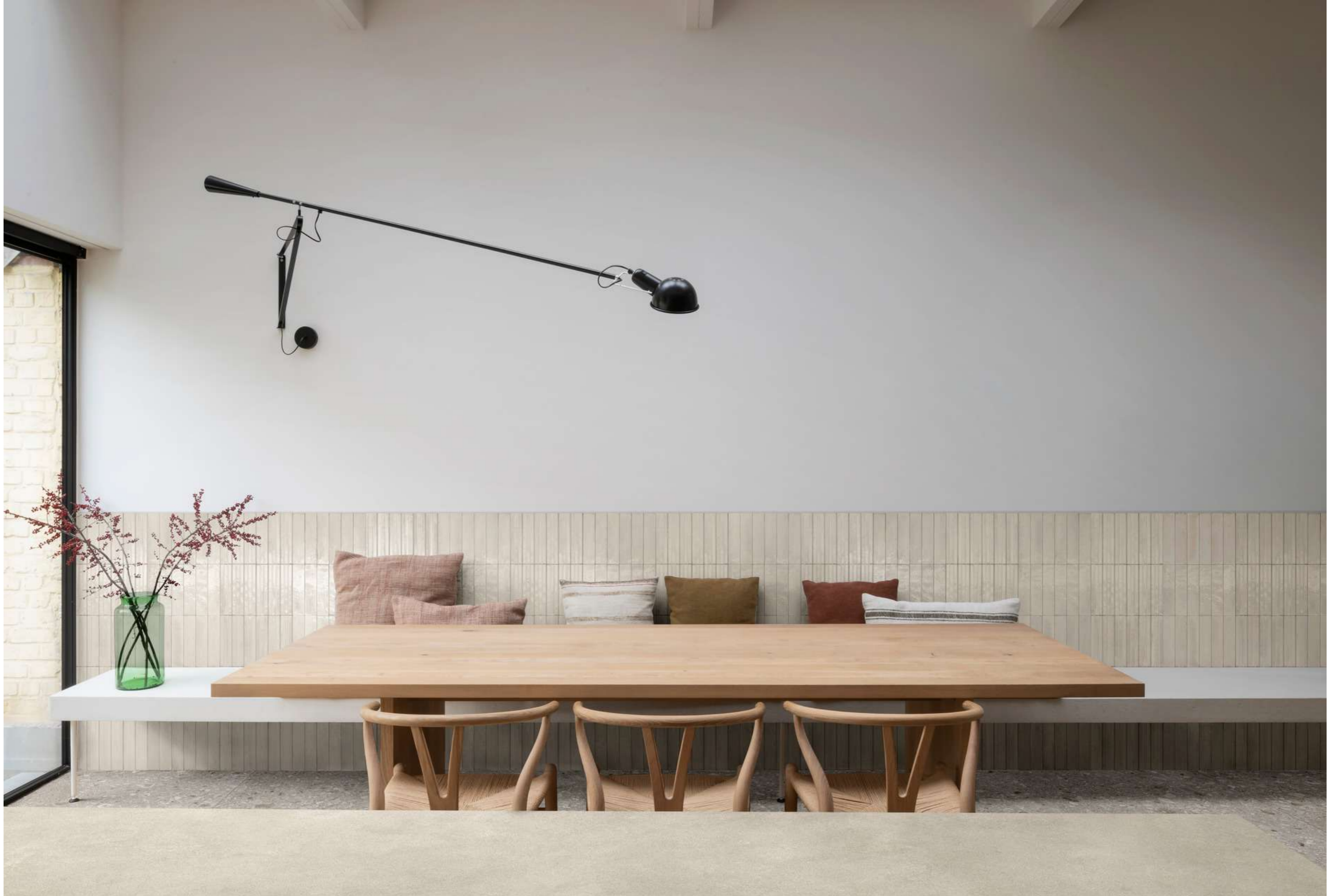
RCFJ Stratford Clay Natural Rt 120x278cm - RCU1 Look Lino Glossy 6x24cm - RCU4 Look Lino Struttura 3D Yubi Glossy 6x24cm - RCXL Ceppo Beige Rt 90x180cm