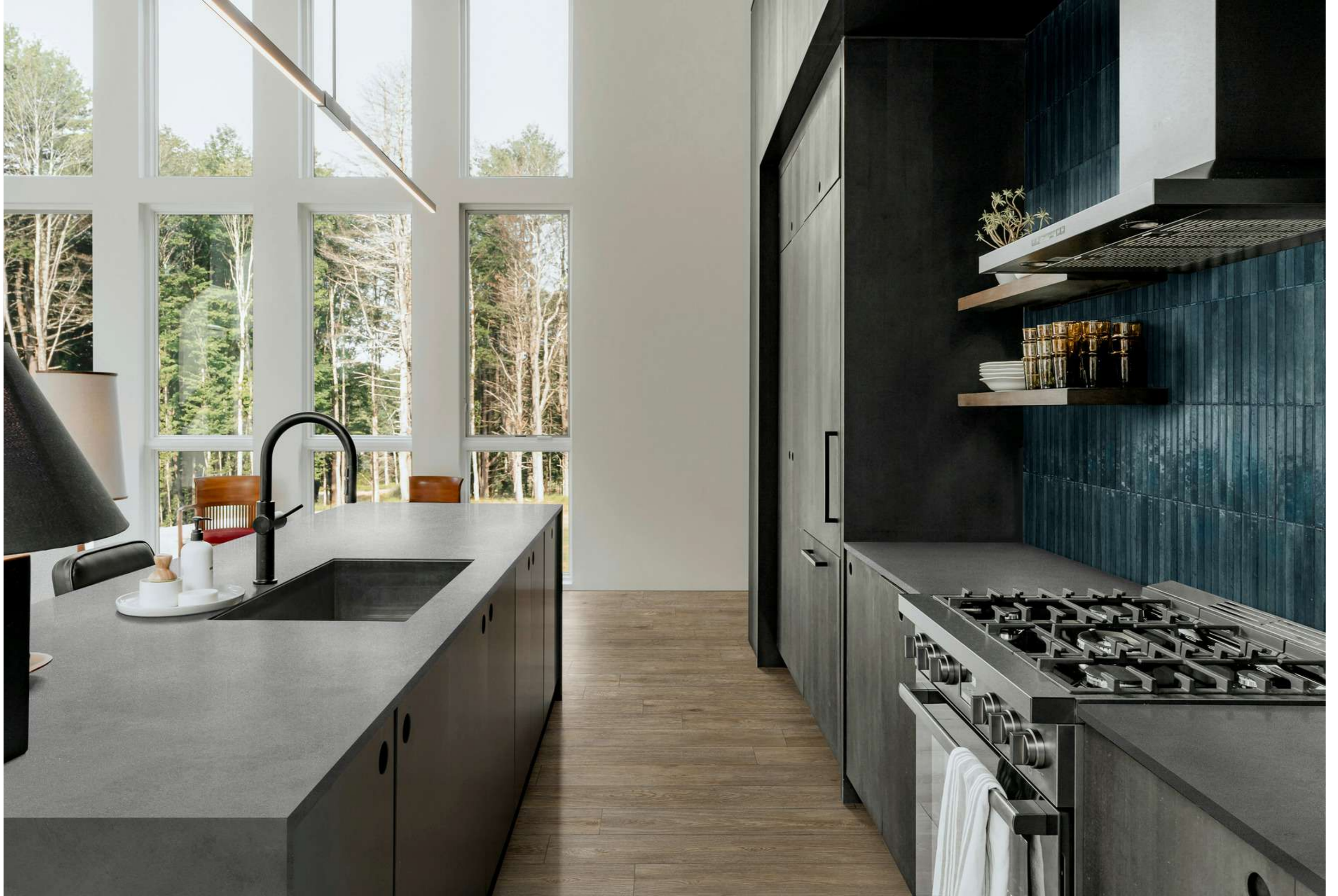
RADZ Inedito Cenere Rt 20x120cm - RCFK Stratford Dark Grey Natural Rt 120x278cm - RCUA Look Blu Struttura 3D Yubi Glossy 6x24cm