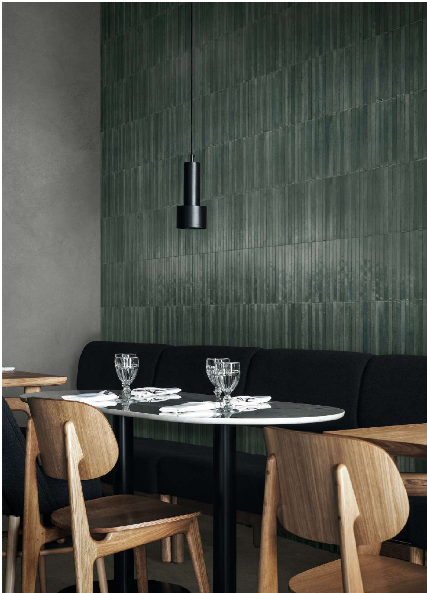
R8XD Stratford Dark Grey Rt 120x120cm - RCFK Stratford Dark Grey Natural Rt 120x278cm - RCU9 Look Avio Struttura 3D Yubi Glossy 6x24cm