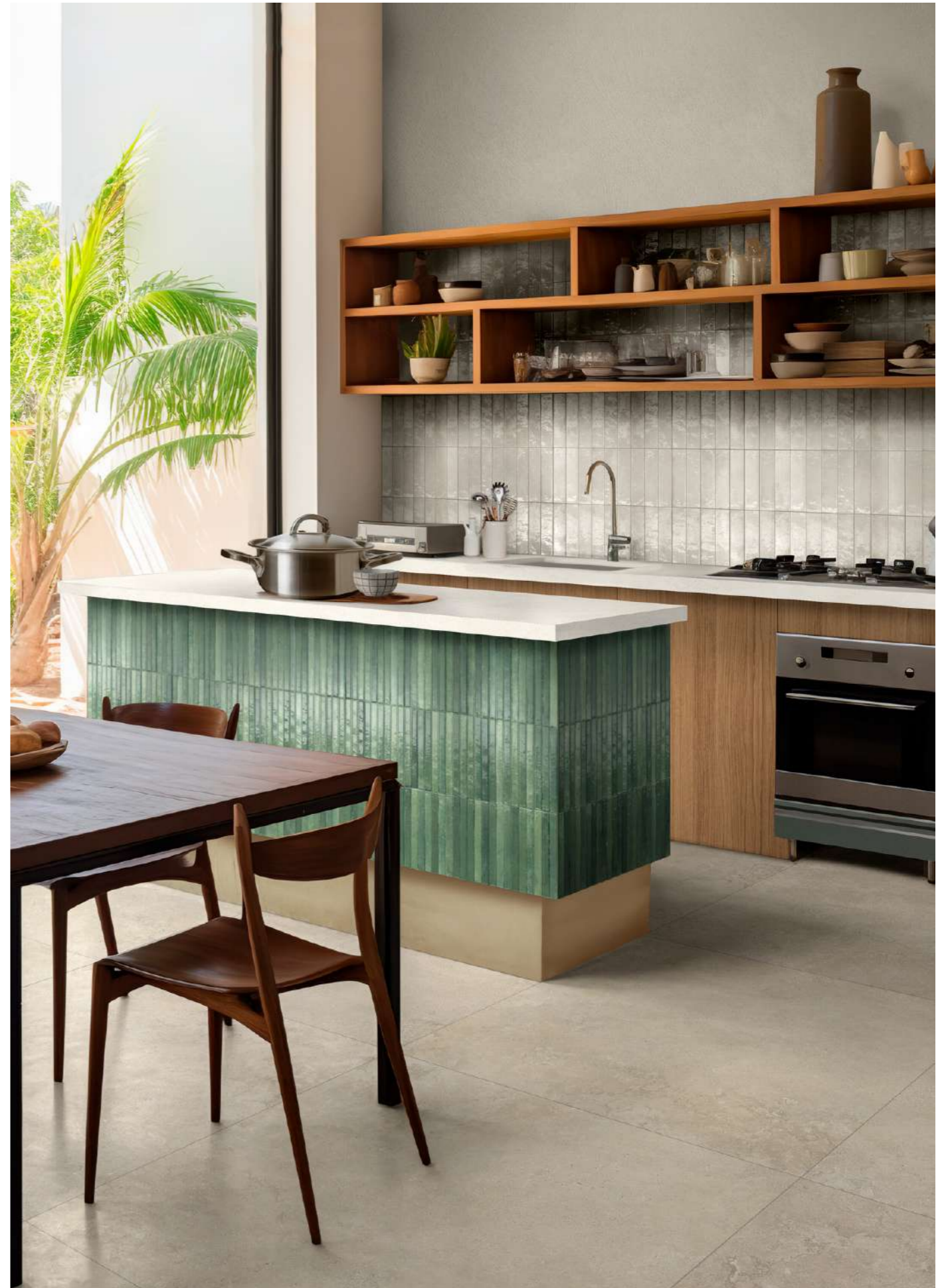
RCFP Stratford White Natural Rt 120x278cm - RCU1 Look Lino Glossy 6x24cm - RCU8 Look Verde Struttura 3D Yubi Glossy 6x24cm - RCUY Stoneplay Mayenne Beige Rt 100x100cm