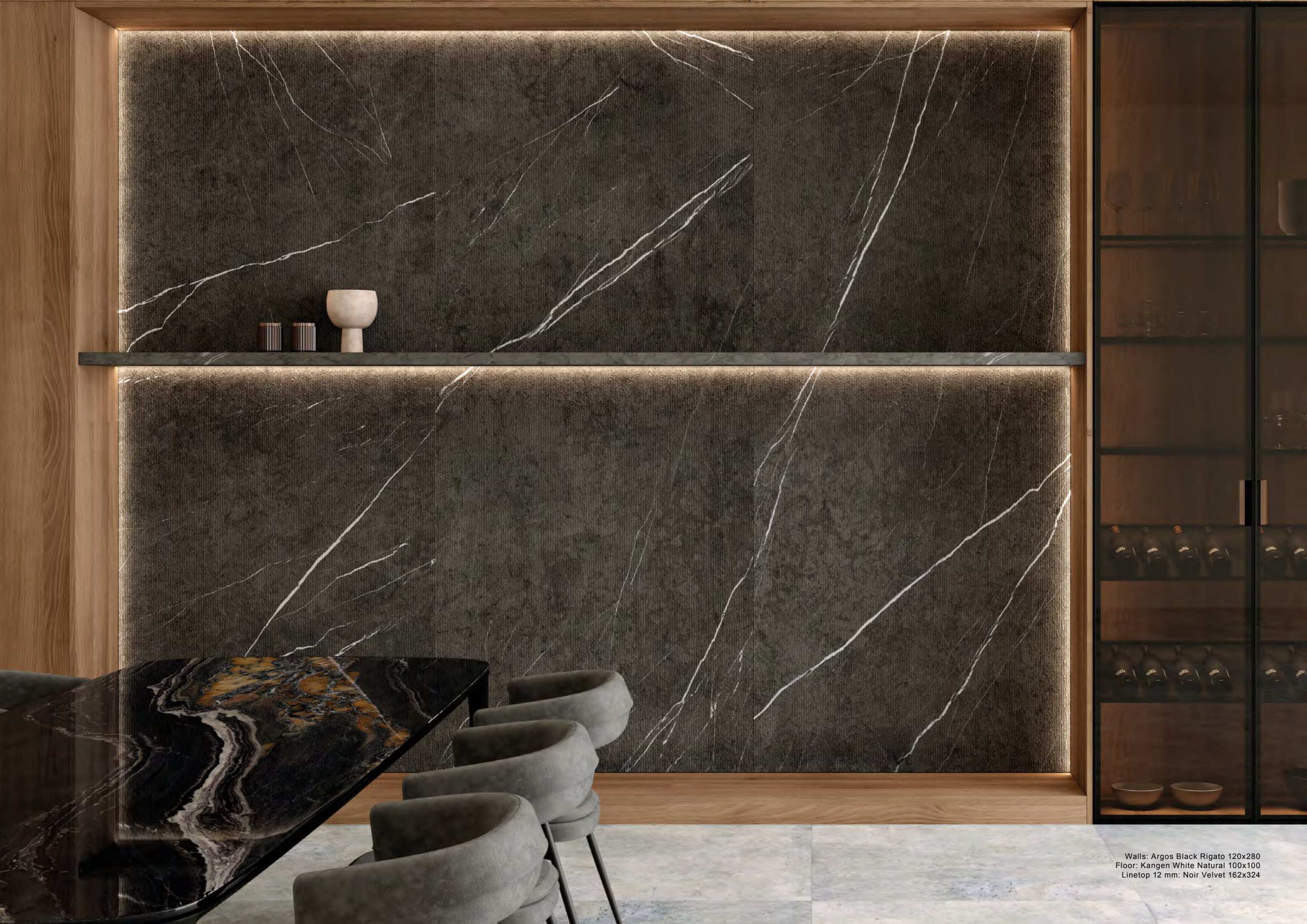
Walls: Argos Black Rigato 120x280 Floor: Kangen White Natural 100x100 Linotop 12 mm: Noir Velvet 162x324