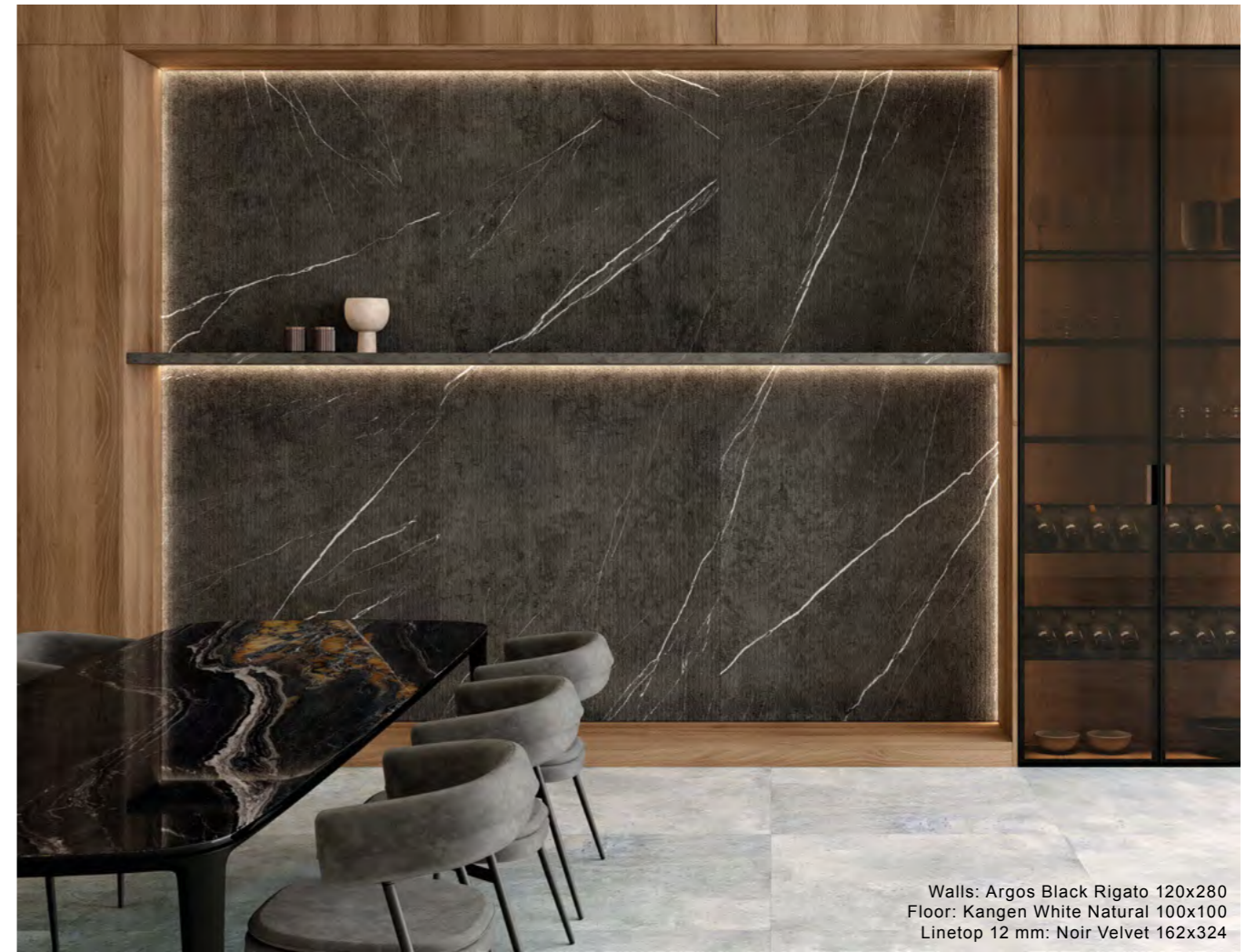
Walls: Argos Black Rigato 120x280 Floor: Kangen White Natural 100x100 Linetop 12 mm: Noir Velvet 162x324